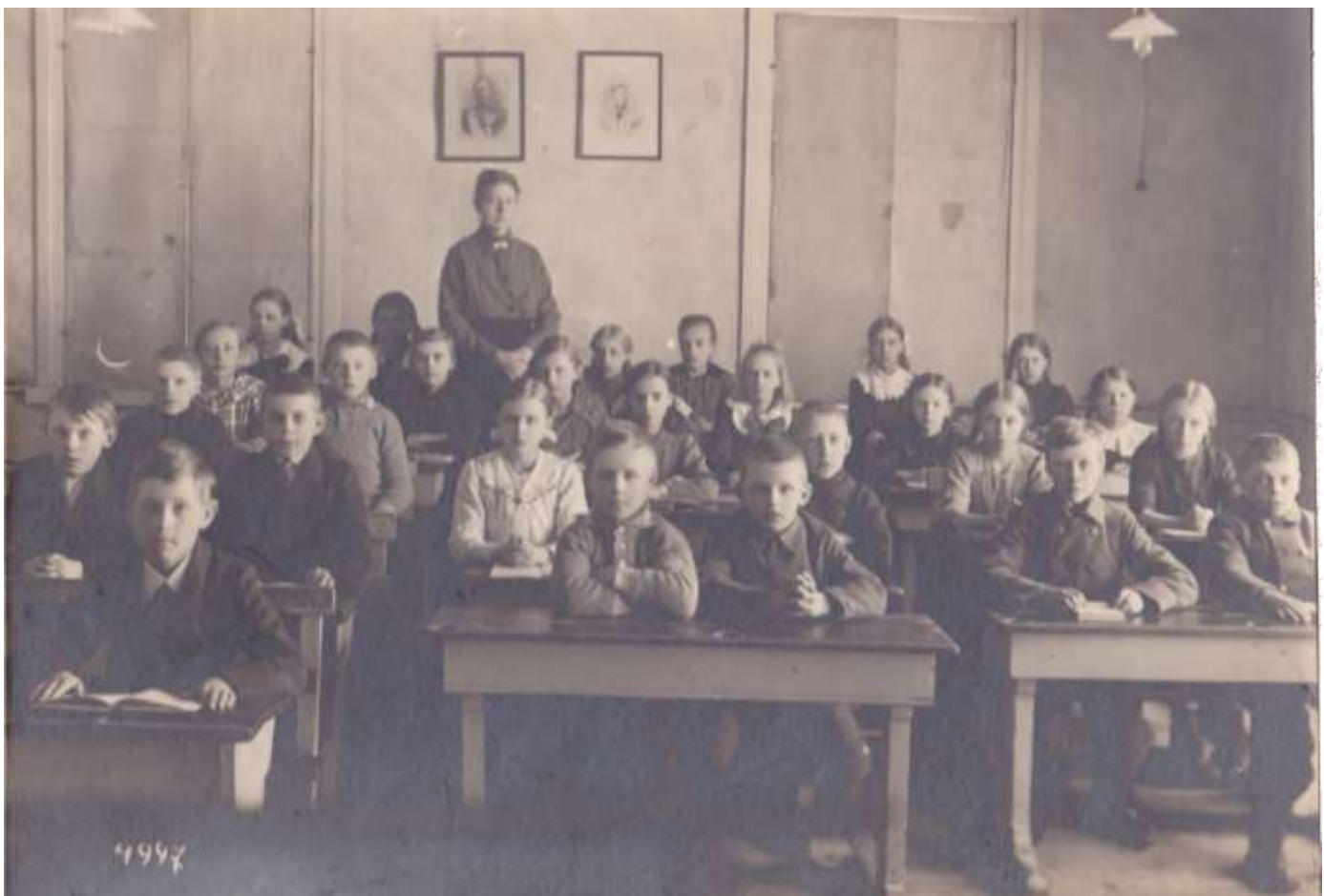
Födda omkring 1910, fotot taget ca. 1921, klass 4–6