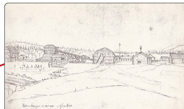
Teckning av C. J. F. Plagemann, föreställande Gyljens bruk 1/10 1835

Spardammen på 1950-talet I dag finns inte dammen och byggnaden på fotot kvar.