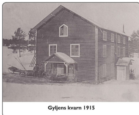
Gyljens kvarn 1915

Avstånd från badplatsen till Spånhopan: 640 meter.