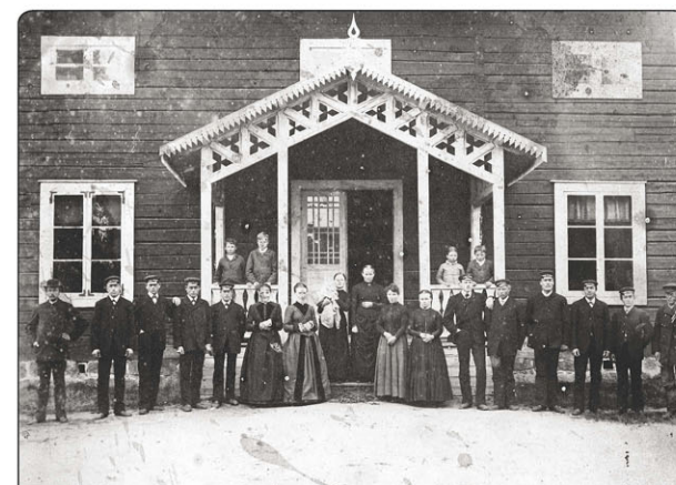
Gamla herrgården i Gyljen

I det markerade området på kartan låg huvuddelen av de anläggningar som hörde till bruket. Närmast masugnen (byggnaden med den långa rampen) som var i bruk från 1828 till 1856 ligger en klenmsmedja. Bakom kolhuset (jämför med fotot nedan!) i mitten syns kontor och inspektorsbostad (gamla herrgården, se fotot nedan).